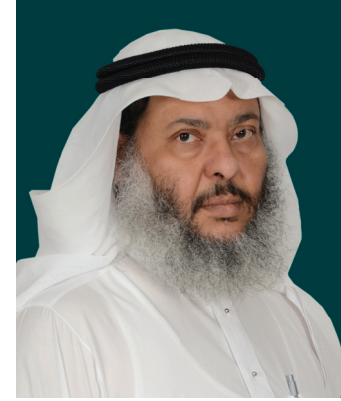
أ.د.عدنان البار رئيس مجلس إدارة الجمعية

وهذه الخطة التشغيلية التي بين أيدينا تغطي أربعة عشر هدفاً الرئيسية من خلال نحو 400 مشروع وبرنامج تقوم على تنفيذها كافة إدارات الجمعية وفروعها.